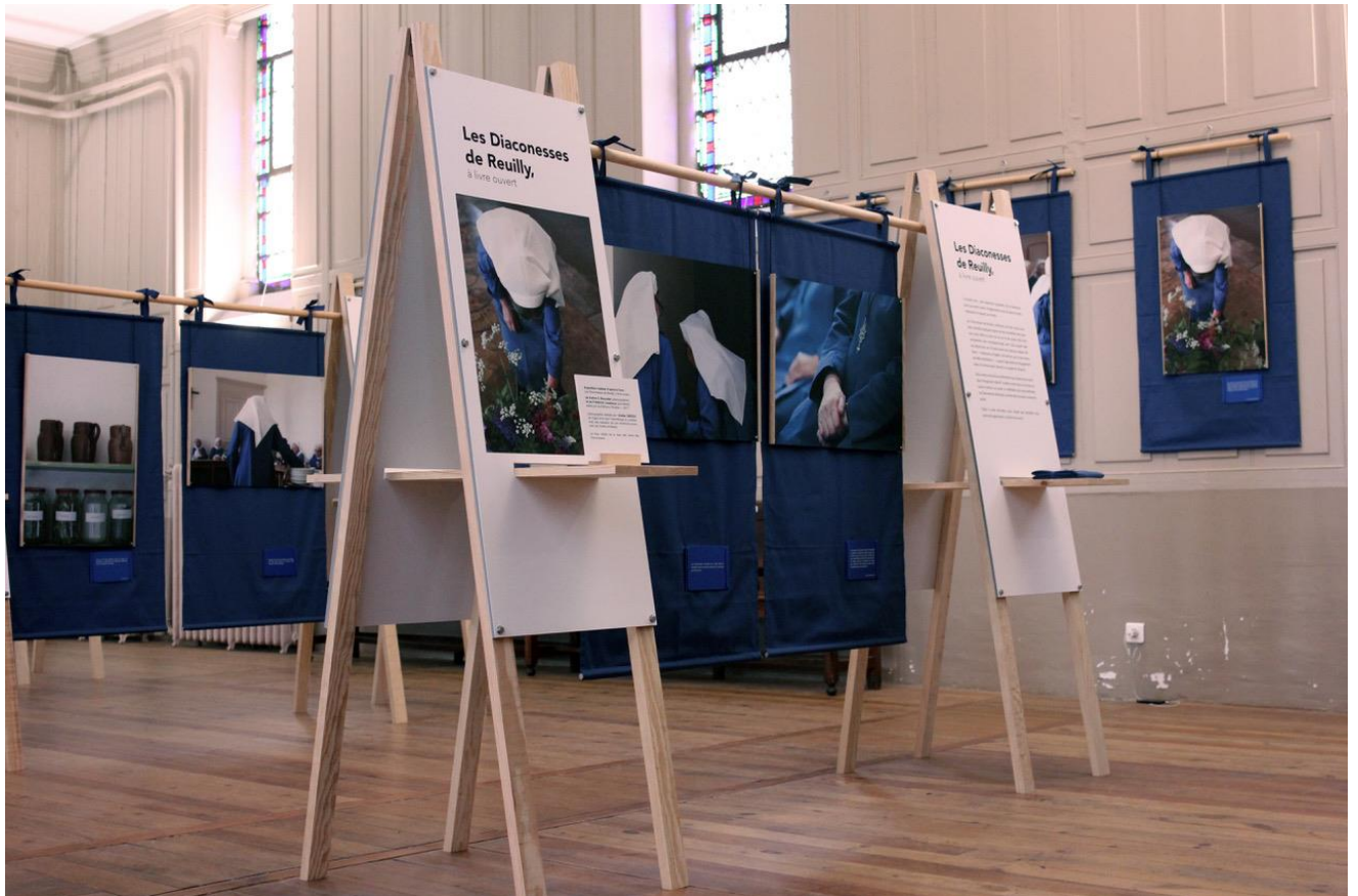
Photographie de l'exposition par l'Atelier Grizou

Issue du livre « Les Diaconesses de Reully, à livre ouvert » écrit par Frédéric Casadesus avec des photographies de Karine S. Bouvatier, l'exposition sur les Diaconesses de Reully invite à une rencontre unique avec les sœurs. Scénographiée par l'Atelier Grizou et facile à monter, l'exposition peut se commander directement auprès de la Communauté des Diaconesses de Reully. Elle tourne déjà dans plusieurs paroisses en France et sera au Musée du Désert à l'été 2018.